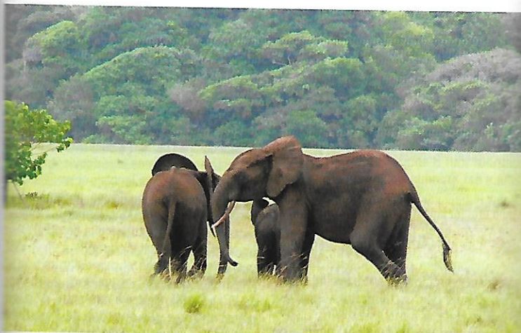
Éléphants dans le parc de Loango

d'oiseaux dont les plus courants sont les tisserins (très bruyants), l'ombrette africaine, les rapaces comme le vautour palmiste, les touracos, les calaos, les perroquets gris, les bis noirs, les martins-pêcheurs, les aigrettes et les hérons près de la lagune ou dans les savanes marécageuses, les becs-en-ciseaux et les sternes en bord de mer, les guépiers et les rolliers dans les savanes.