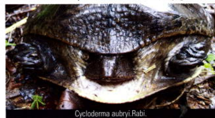
Cycloderma aubryi Rabi.

irascible. L'autre espèce de tortue à carapace molle, Cycloderma aubryi , est nettement plus petite et ne mord jamais. Elles se nourrissent toutes les deux principalement de petits animaux aquatiques. La seule tortue terrestre que compte le Gabon, Kinixys erosa , est très commune dans les forêts et on la trouve aussi régulièrement dans les plantations. Elle se nourrit surtout de végétaux, mais va également se régaler de temps à autre d'un escargot. Elle est en partie nocturne et il n'est pas rare de la croiser de nuit en forêt occupée à dévorer un champignon.